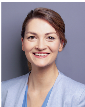
Judith Gerlach MdL, Bayerische Staatsministerin für Digitales