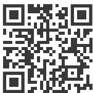
QR-Code-Beispiel mit Link zur Webseite von digital verein(t).

Für die QR-Code-Spende ist eine Internetverbindung notwendig und es muss ein QR-Code-Scanner auf dem genutzten Gerät installiert sein. Die Einsatzmöglichkeiten sind vielseitig: Der Code kann die Spender:innen beispielsweise auf eine Website oder ein Spendenformular weiterleiten, einen Anruf oder den Versand einer SMS auslösen oder auch zu einer PayPal-Aktion führen.