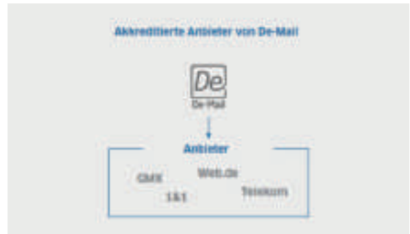
Die Service DE-Mail wird auch von den deutschen Behörden akzeptiert

Es gibt zwei Verschlüsselungsmethoden: Die Transportverschlüsselung verschlüsselt jede E-Mail zwischen Absender:in und Empfänger:in. Dabei liegt die E-Mail allerdings unverschlüsselt auf den Servern der E-Mail-Anbieter vor. Bei der Ende-zu-Ende-Verschlüsselung können dagegen nur Absender:in und Empfänger:in eine Nachricht lesen. Der E-Mail-Anbieter und andere Dritte haben keinen Zugriff auf die gesendeten Inhalte. Durch diese Art der Verschlüsselung wird aus einer normalen E-Mail ein Brief samt Umschlag.