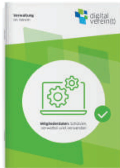
Handbuch von digital verein(t): Verwaltung im Verein. Mitgliederdaten schützen, verwalten und verwenden.

Wie Geräte sicher eingerichtet werden, kann im digital verein(t)-Handbuch „Gemeinsam im Netz: Geräte absichern, Informationen sammeln und Netzwerke teilen“ nachgelesen werden. Ausführliche Informationen zu den geltenden Datenschutzrichtlinien sind im digital verein(t)-Handbuch „Mitgliederdaten: Schützen, verwalten und verwenden“ zu finden.