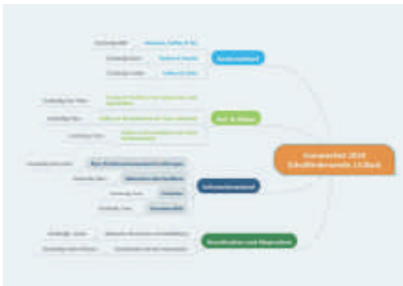
Mindmap zur Organisation eines Sommerfestes, erstellt mit Mindmeister

Eine Mind-Map (auf Deutsch: Gedächtniskarte) ist eine Technik, bei der die Zusammenhänge von Gedanken zu einem bestimmten Themengebiet visuell dargestellt werden. Die Darstellung erfolgt nach dem Prinzip der Kategorisierung, so dass Beziehungen durch gemeinsame oder ähnliche Merkmale zwischen den Begriffen dargestellt werden.